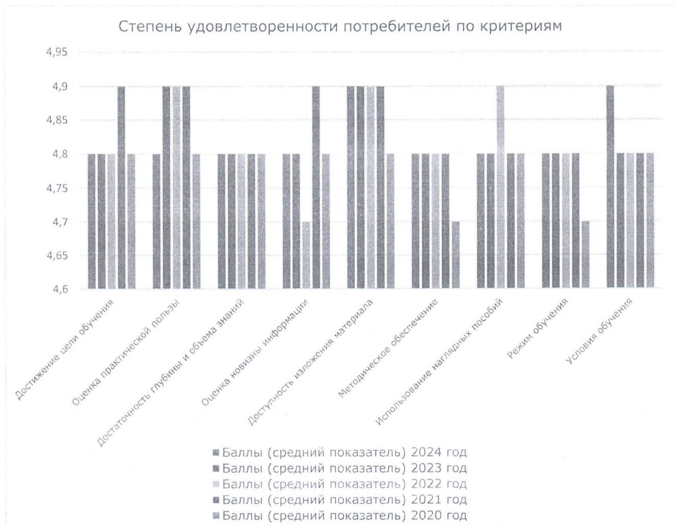
Рисунок 1. Удовлетворенность потребителей по критериям

Мониторинг уровня удовлетворенности потребителей по качеству работы преподавателей осуществляется на основании анализа результатов анкетирования.